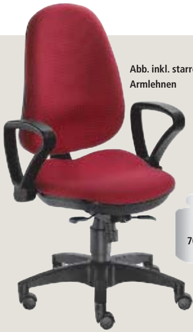
Abb. inkl. starren Armlehnen